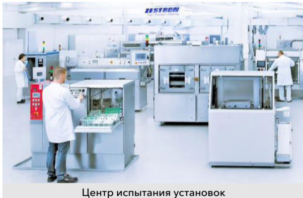
Центр испытания установок