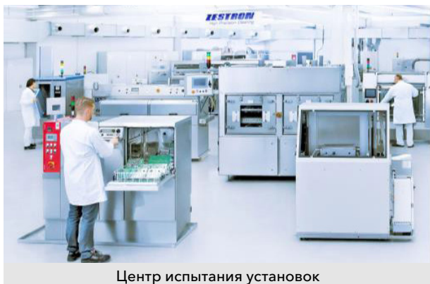
Центр испытания установок

Независимый испытательный центр – самый большой выбор ведущих установок, химии и аналитики